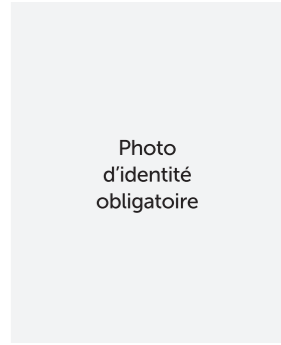
Photo d'identité obligatoire